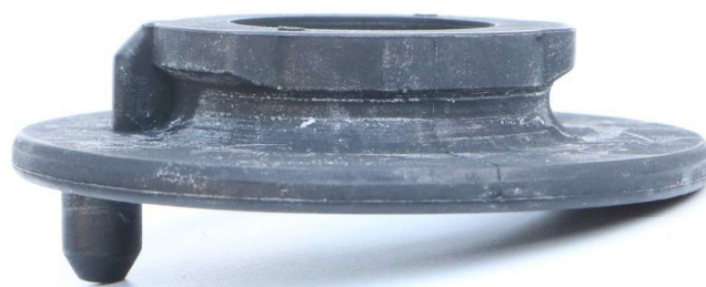
Fig. 1: H&R spring rubber

Don't mount the shock absorber under tension. See general installation instructions!