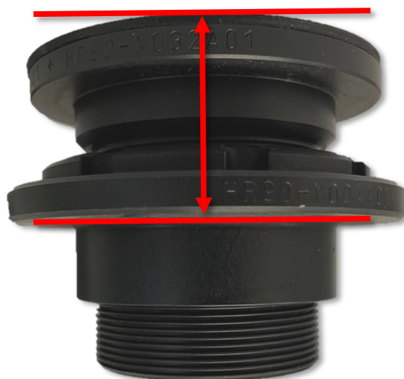
Abb. 5: Einstellmaß HA (Abb. ähnlich) Fig. 5: RA adjustment dimension (Fig. may vary)