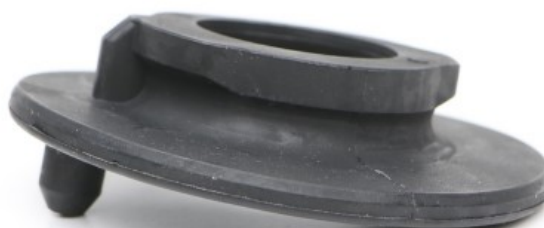
Abb. 7: H&R Federgummi Fig. 7: H&R spring pad