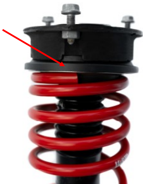
Abb. 4: Position Federende Fig. 4: position spring end