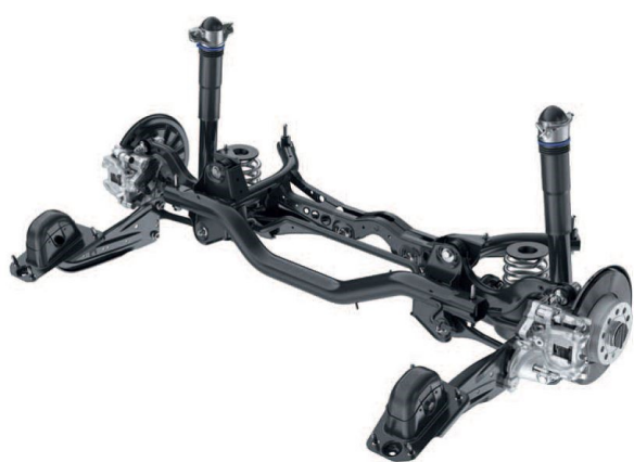
Abb. 1: Mehrlenker-Hinterachse