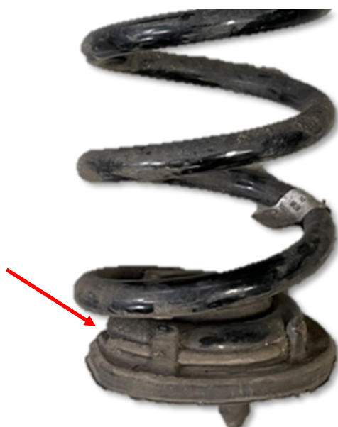
Abb. 6: OE vulkanisiertes Federgummi Fig. 6: OE banded spring pad