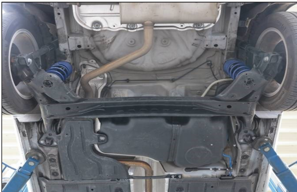
Abb. 2: Verbundlenker-Hinterachse (Abb. ähnlich)

Fig. 1: Multi-link rear axle (Fig. may vary)