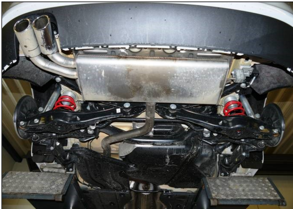
Abb. 1: Mehrlenker-Hinterachse (Abb. ähnlich)

Fig. 1: Multi-link rear axle (Fig. may vary)