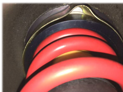
Fig. 5: 5 series E28 support bearing