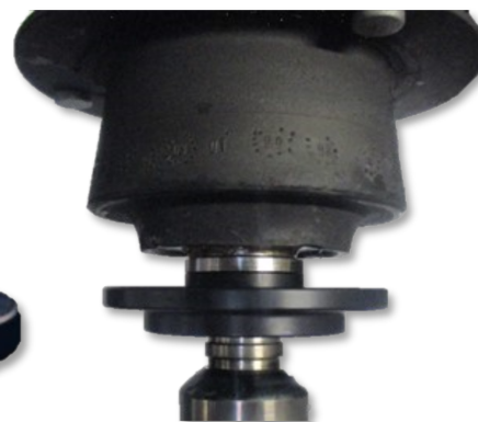
Fig. 3: fitting OE support bearing