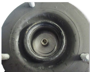
Fig. 4: fitting OE support bearing