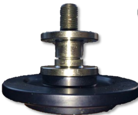
Fig. 2: fitting H&R sleeves