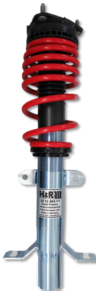
Abb. 2: VA zusammengebauter Zustand