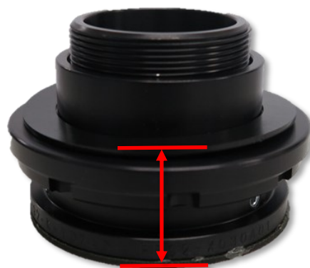
Abb. 4: Einstellmaß HA