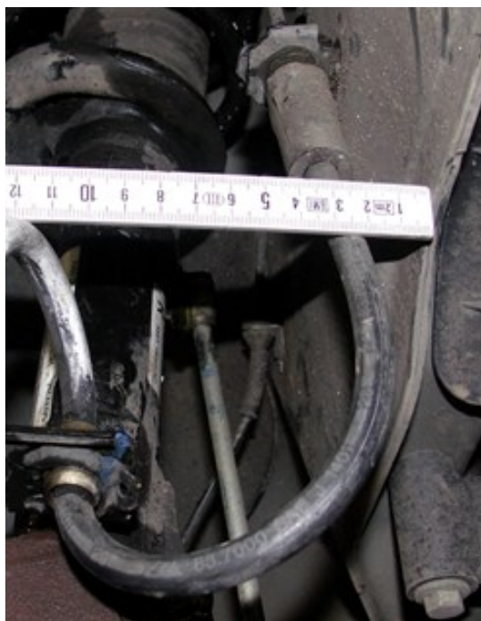
Abb.3: Abstand zwischen Bremsschlauch & Spritzwand