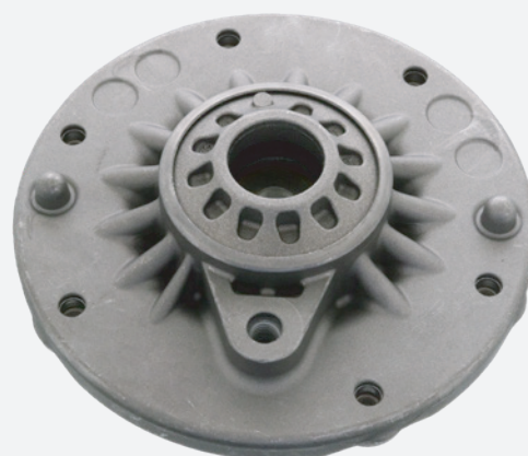
Рис. 2. febi 102532 с 6 отверстиями M8